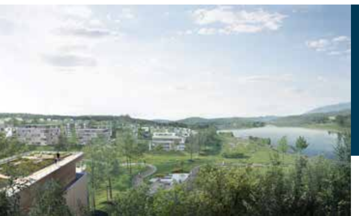
Illustrasjon: Hille Melbye arkitekter

Bærum FrP vil realisere utbygging på Fossum primært som et område for småhusbebyggelse. Med den unike tilknytningen til marka og elven vil