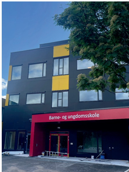
BARNEHAGER OG SKOLE