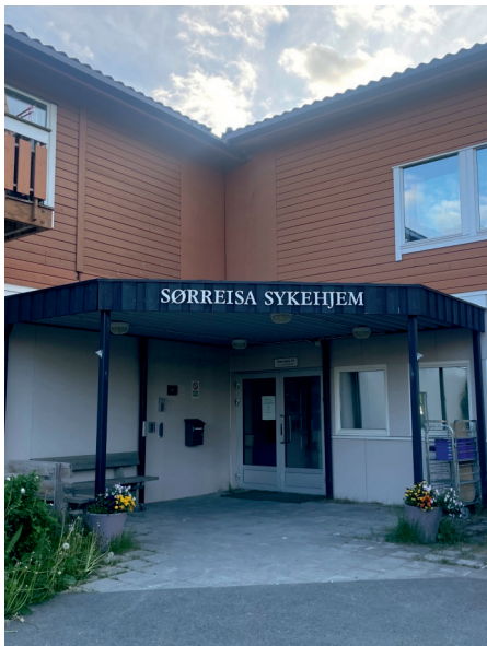
STYRKE HELSE OG OMSORGSTJENESTER