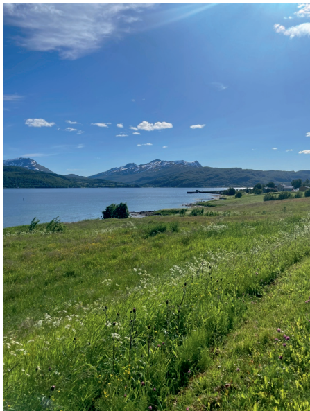
JA–HOLDNING I AREAL SAKER!