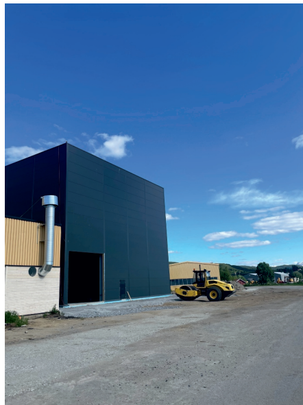
INDUSTRI, NÆRING OG UTVIKLING