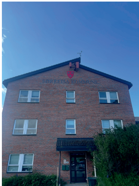
ØKONOMI OG KOMMUNAL DRIFT