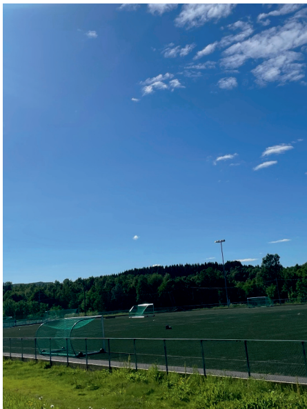
IDRETT OG KULTUR