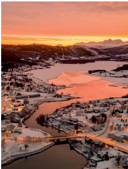
SØRREISA – EN KOMMUNE FOR ALLE