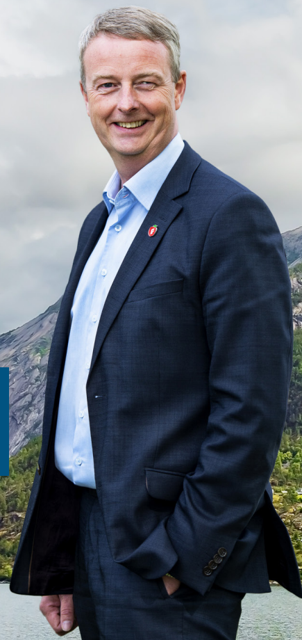
Fylkesordførarkandidat Vestland FrP Terje Søviknes