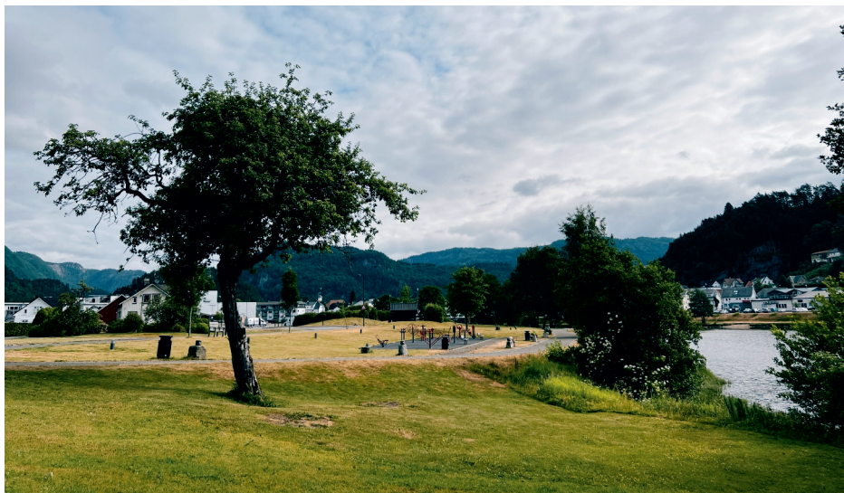
Vi vil frede grøntområde i Kvinaparken.

Si NEI til vindturbiner til lands og havs.