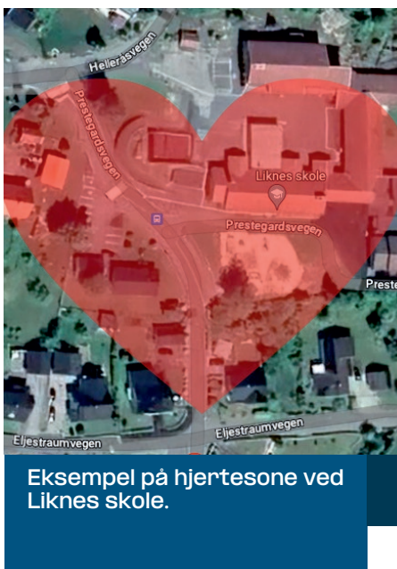
Eksempel på hertesone ved Liknes skole.

Ta vare på den kristne kulturarven og det kulturelle og sosiale arbeidet som kirken bidrar med i lokalsamfunnet vårt.